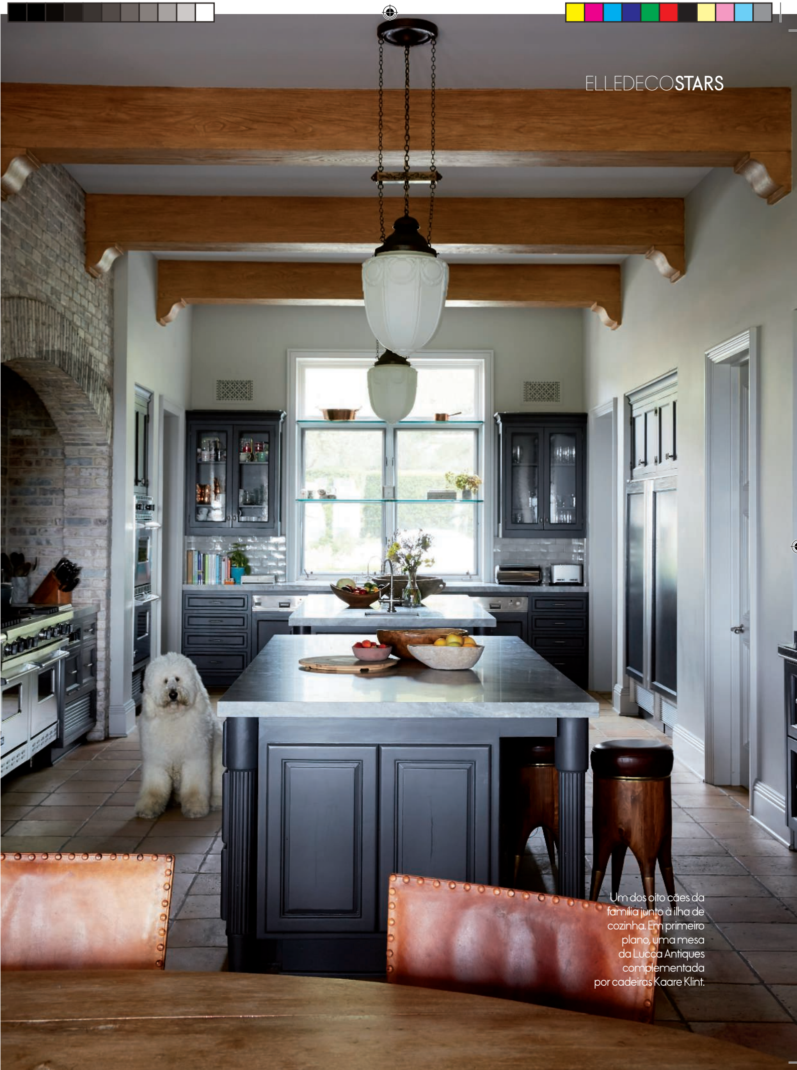
Um dos oito cães da família junto à ilha de cozinha. Em primeiro plano, uma mesa da Lucca Antiques complementada por cadeiras Kaare Klint.